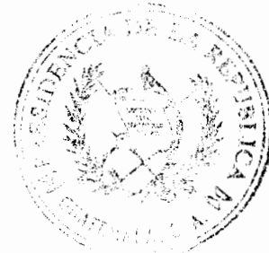
ALVARO COLOM CABALLEROS PRESIDENTE DE LA REPÚBLICA

Sin otro particular, aprovecho la oportunidad para reiterarle las muestras de mi consideración y estima.